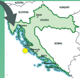
MDC Vodice | Kroatien

Vodice liegt im Herzen von Dalmatien, umgeben von den Städten Zadar, Šibenik, Split. Ausflugsziele erreichen Sie bequem per Leihwagen oder komfortablen Reisebussen.